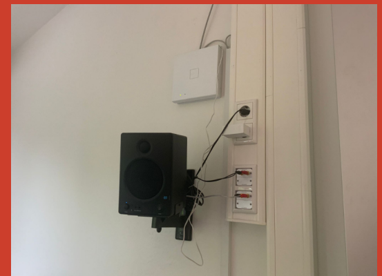
Das WLAN im gesamten Gebäude